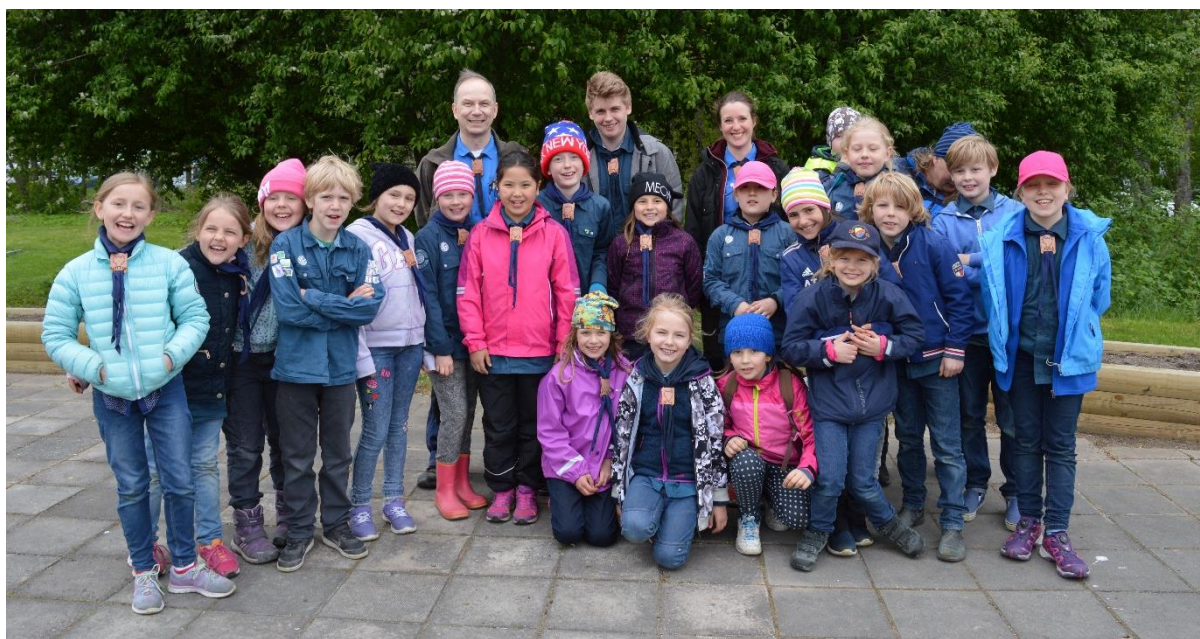
Bild på Waingunga under tävlingen Myrstigen 2016, känner du igen någon scout?

Hej alla Waingungascouter och föräldrar! Snart är det dags för scoutårets första övernattningsinbjudan! Vi kommer att hålla till i scoutlokalen och göra massor av roliga scoutsaker. Dessutom åker vi iväg till Sydpoolens äventyrsbad och givetvis kommer man att få ett övernattningsmärke om man kommer!